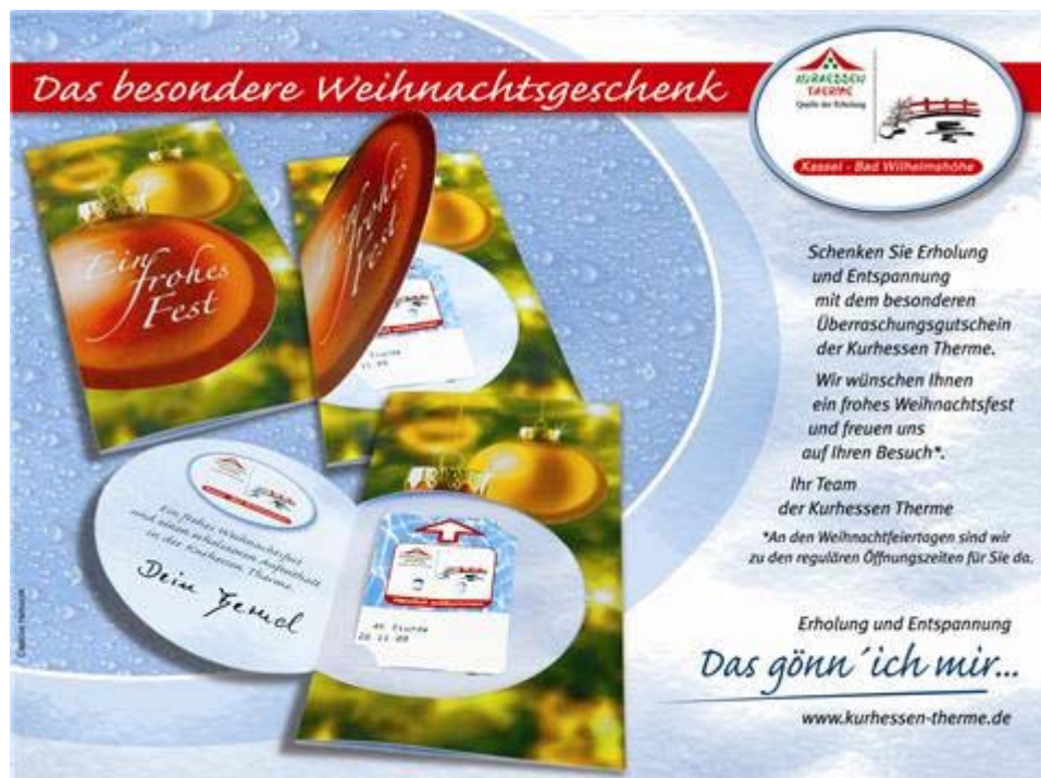
Die Weihnachtskarte kostet 0,50 Euro zusätzlich.